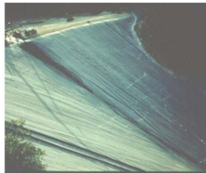
Barragem com face em geomembrana (**)

Vazamentos através de geomembranas ocorrem principalmente por defeitos nas soldas e por perfurações. Geralmente os danos são minimizados por meio de programas de controle de qualidade de instalação e execução da obra. No entanto, vazamentos são