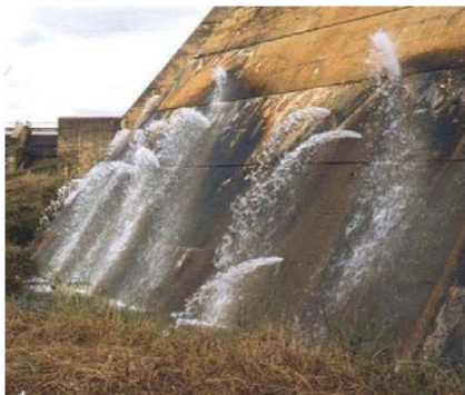
Barragem com vazamento (**)

Geomembranas são praticamente impermeáveis à água e são comumente utilizadas para criar uma barreira hidráulica na face montante de barragens. As geomembranas podem também estar expostas ou ser cobertas por painéis de concreto ou “rip-rap”. O uso de geomembranas tem se mostrado particularmente útil na recuperação de barragens antigas de concreto. A exposição da geomembrana pode reduzir o seu tempo de vida útil, devido à degradação por radiação ultravioleta, mas reparos podem ser feitos mais facilmente do que no caso de geomembranas cobertas. As geomembranas cobertas também podem estar sujeitas a danos, tais como perfurações causadas pelos materiais sobrejacente e/ou subjacente. Geotêxteis são freqüentemente instalados sob e, algumas vezes, sobre a geomembrana para protegê-la contra perfurações, servindo como colchões redutores de concentrações de tensões.