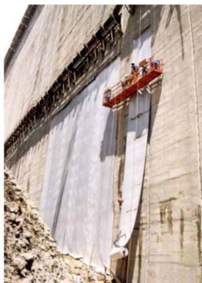
Revestimento da face montante de uma barragem (**)

O sistema geossintético é fixado à face da barragem por meios mecânicos, geralmente com o uso de parafusos de ancoragem e arruelas de aço. Sistemas de vedação e selantes são usados para impermeabilizar as conexões e juntas. As barragens com geometrias complexas são mais susceptíveis a apresentar defeitos em soldas e juntas.