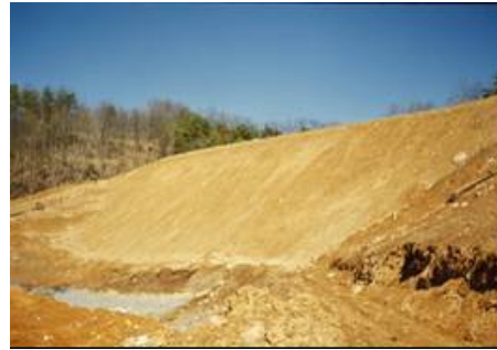
Aterro reforçado concluído