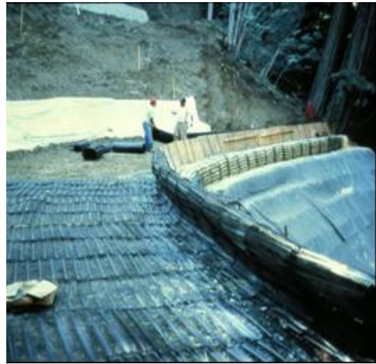
Exemplo de talude recuperado com uma estrutura de solo reforçado

Camadas de reforços geossintéticos são usadas para estabilizar taludes contra rupturas profundas por meio de camadas horizontais de reforço primário. O talude reforçado pode ser parte da restauração de um talude rompido e/ou para aumentar a resistência de taludes de aterros rodoviários. As camadas de reforço permitem que sejam construídos taludes mais íngremes do que no caso sem reforço. Pode ser necessário estabilizar a face do talude (particularmente durante o lançamento e compactação do solo) utilizando-se reforços secundários relativamente curtos e menos espaçados e/ou envelopando-se as camadas de reforço na face. Na maioria dos casos a face do talude deve ser protegida contra a erosão. Isto pode requerer materiais geossintéticos tais como geocélulas pouco espessas preenchidas com solo ou geomantas relativamente leves, que geralmente são usadas para ajudar a fixação da vegetação. A figura abaixo mostra que um dreno interceptor pode ser necessário para eliminar forças de percolação no maciço reforçado.